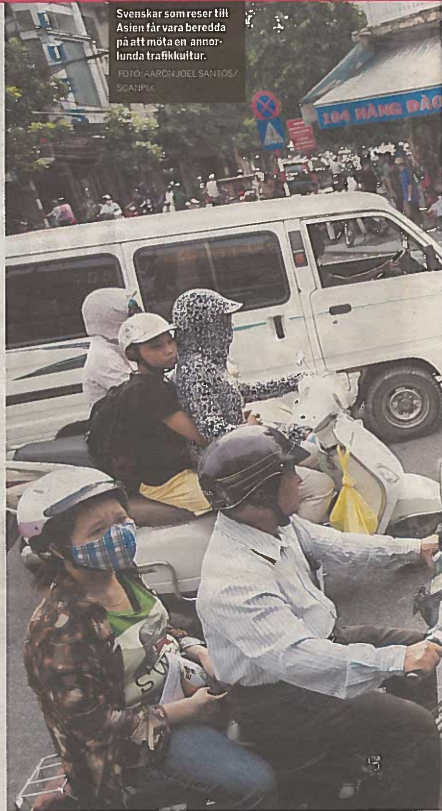
Svenskar som reser till Asien får vara beredda på att möta en annorlunda trafikskultur.

SOS International ägs av 24 nordiska försäkringsbolag. Företaget har personal med specialkompetens för att hjälpa sjuka och skadade människor utomlands.